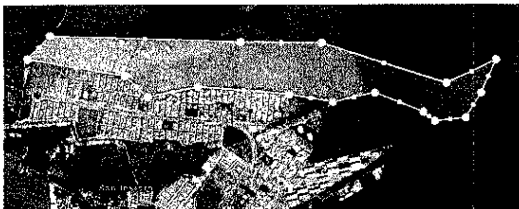
Ilustración 1 Zona geográfica.

En constancia de lo cual, suscribo este original, en mi calidad de representante legal de la persona prestadora, el día 05 de diciembre de 2018.